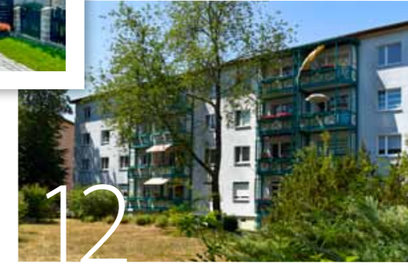
Sommerliche Wohnungsangebote im Lausitzer Krabat- und Seenland