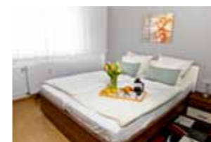
Für einen wundervollen Urlaub in Hoyerswerda sorgen unsere Gästewohnungen mit Wohlfühl-Ambiente. Mehr Infos auf wh-hy.de .