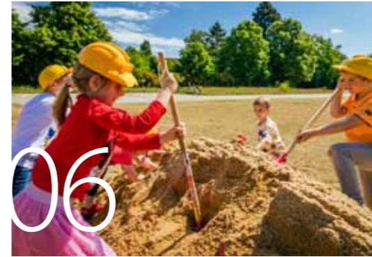
Spatenstich für Spielplatz in der „Seenlandschaft“

Unsere Wohnungsgesellschaft mbH unterstützt die mobile Jugendarbeit, auch weil Treffpunkte für die Kinder und Jugendlichen unsere Stadt fehlen. Seit vielen Jahren stellen wir dafür das Grundstück zur Verfügung und finanzierten die Fußballtore am Bauwagen. Mit dem Baustart des Großspielplatzes steht nun ein kleiner Umzug für den Bauwagen und die Fußballtore bevor. Ausgegrenzt wird niemand, der Spielwagen bleibt als Gesamtkonzept ganz in der Nähe erhalten.