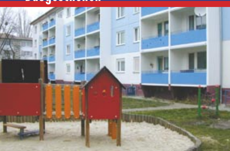
Otto-Lilienthal-Straße 1 - 7

Nach der Sanierung der Balkone und Fassaden