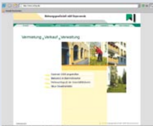
Bild links: Startseite Bild mitte: Zeitungsarchiv Bild rechts: Jörn Stange, Leiter Organisation / EDV

Für Anregungen, was Sie noch auf unserer Homepage finden möchten, sind wir dankbar. Bitte teilen Sie uns diese gleich per Email unter kontakt@wh-hy.de mit.