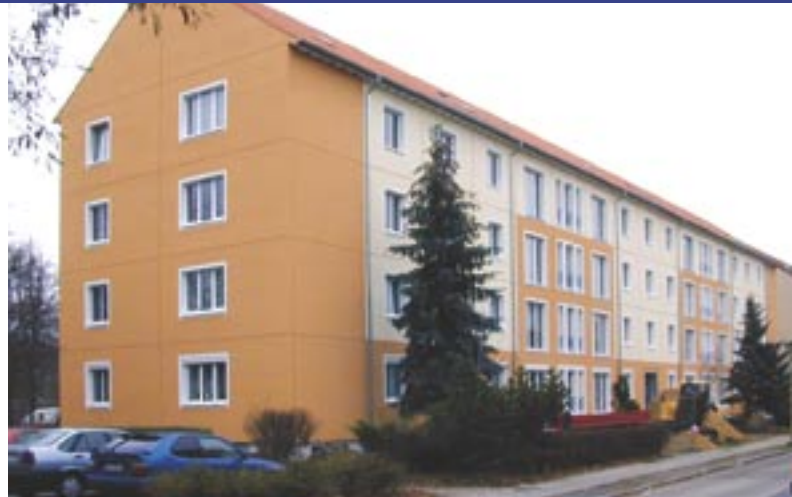
Konrad-Zuse-Straße 9 - 13

Nach der Sanierung der Balkone und Fassaden